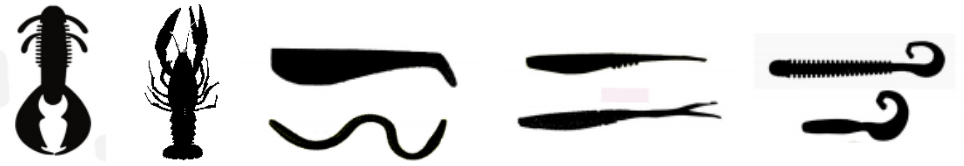
Créatures, écrevisses, grenouilles, shads, finesses, slug, virgules, glubs, ...