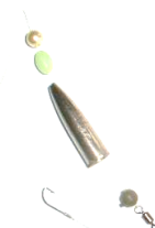
Balle brillante ou terne