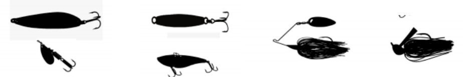
Cuillères ondulantes et tournantes, lames vibrantes, spinnerbaits, chatterbaits, buzzbaits, jigs, ...