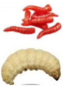
Larves artificielles (Teignes et asticots)