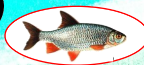
Poissons vifs ou morts